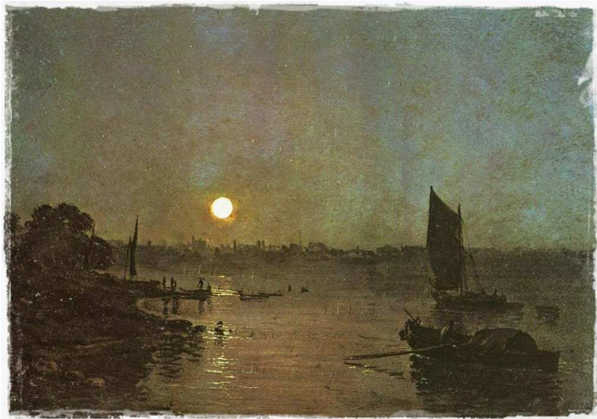
ภาพชื่อ Moonlight โดย William Turner

คัมภีร์ “มิลินทปัญหา” นั้นเป็นคัมภีร์สำคัญของพุทธศาสนา นิกายเถรวาท แม้ไม่ใช่คัมภีร์ชั้นต้นที่เรียกว่า “พระบาลี” แต่ก็ได้รับการยอมรับว่าสำคัญ อย่างน้อยก็ไม่แพ้ “อรรถกถา” ใน ประเทศเถรวาทบางประเทศเช่นพม่า มิลินทปัญหาถูกจัดเข้าใน พระไตรปิฎก คือไม่ได้เป็นอรรถกถาอย่างที่ไทยเราจัด ก็ยังแสดงให้เห็นว่าตามทัศนะของประเทศเถรวาทที่เวลานั้น สถานะของคัมภีร์