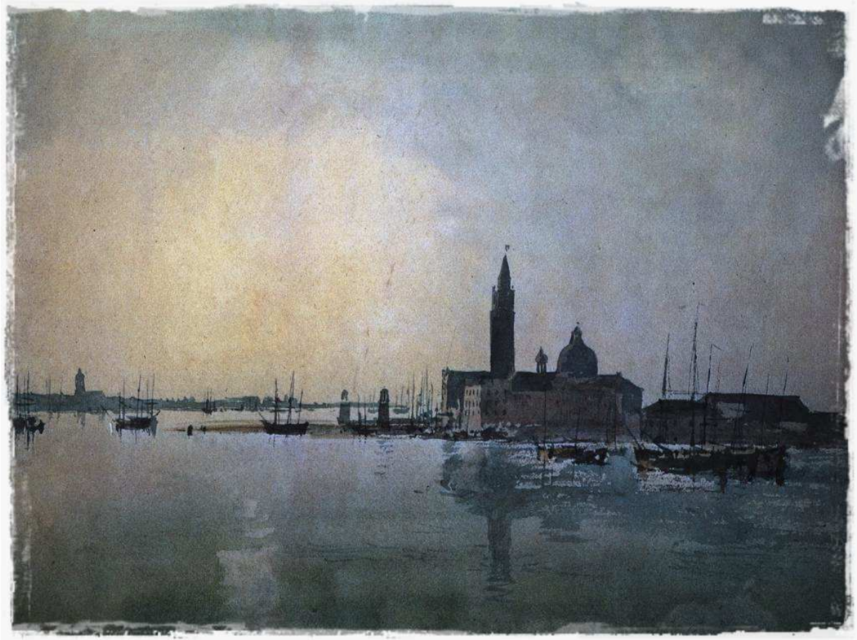
ภาพชื่อ San Giorgio Maggiore at Dawn โดย William Turner