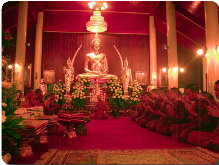
พระพุทธรูปชิตมาร มัชฌิมพุทธกาล ภายในศาลาอรุพงศ์

เล่ามาถึงตรงนี้ก็เห็นถึงความสำคัญของวัดกับพระกรรมฐานสายหลวงปู่มั่น ด้วยเหตุนี้จึงมีพระฝ่ายปฏิบัติมาแวะเวียนพักอาศัย เรื่อยมาจกในอดีตจนถึงปัจจุบัน ลองมาเดินตามวิหารลานพระเจดีย์ไปด้วยกันนะครับ