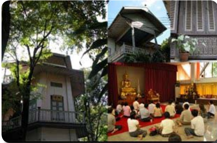
(ซ้าย) หอมราภิรมย์ (บนขวา) กุฎีปัทมราช (ล่างขวา) กิจกรรมศูนย์อบรมภาวนาสิริจันโท