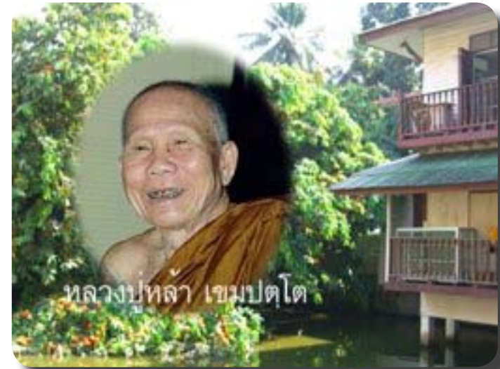
กุฎิพ่อเต่า เคยเป็นที่พำนักของ หลวงปู่หล้า เขมปัตโต

เปิดพระอุโบสถให้ มีเกิร์ตอีกชนิดหนึ่งถ้าเข้ามาในเขตพระอุโบสถแล้ว ลองสังเกตดูดี ดีแปดเขียนอธิการมีจริง!