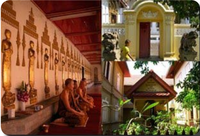
(ซ้าย) ภายในพระวิหารรายมีพระอริยเมตไตรย ๘๐ รูป (ขวา) กุฎิกรรมฐาน

พระเจดีย์ เป็นที่ประดิษฐานรูปปูนปั้นนูนต่ำพระอริยเมตไตรย ๘๐ รูปในอิริยาบถ ยืนนมัสการพระเจดีย์ ยังมีผู้สังเกตไว้ว่า พระสาวกเหล่านี้กำลังเดินจงกรมแสดงถึงจุด ประสงค์ของวัดที่เป็นวัดฝ่ายปฏิบัติ บริเวณด้านหน้าพระสาวกเหล่านี้ ก็ยังเหมาะสม กับการเดินจงกรมอีกด้วย