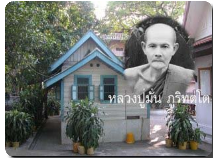
กุฎิไม้หลังเล็ก เคยเป็นที่พำนักของ หลวงปู่มั่น ฐิริทัตโต

ที่ ๓ ของเดือน และการถือศีลอบรมภาวนาในวันสำคัญทางพระพุทธศาสนา เป็นอีกหนึ่งแรงที่จะดำรงไว้ซึ่งการปฏิบัติธรรมให้ยังคงดำรงอยู่ในวัดนี้