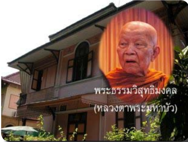
กุฏิดำรงนุกูล เคยเป็นที่พำนักของ หลวงตามหาบัว ญาณสมฺปนฺโน

เยี่ยมที่กุฏินี้ด้วย ยังมีปริศนาที่ปรากฏในประวัติหลวงตาที่ว่า ในเวลาเรียนท่านก็นั่งสมาธิเดินจงกรมภาวนาด้วย แล้วทางที่ท่านจงกรมนั้นอยู่ที่ตรงไหน?