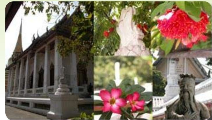
พระอุโบสถ วัดบรมนิวาส

ในฉบับที่แล้ว ผู้เขียนได้กล่าวถึงประวัติและความสำคัญของวัดบรมนิวาสโดยย่อ และได้พาชมสถานที่บางส่วนของวัด ในฉบับนี้ ผู้เขียนขออนุญาตพาชมวัดบรมนิวาสต่อไป