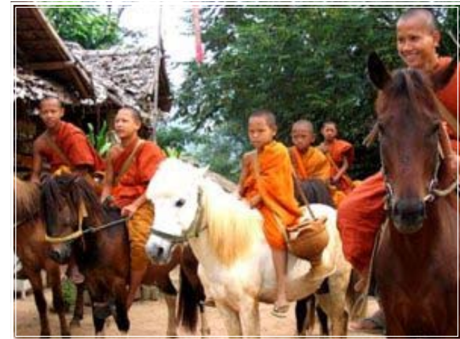
สามเณรน้อยบนหลังม้า

ความเมตตากรุณาของครูบาเหนือชัยทำให้เด็กเหล่านี้มีโอกาสได้ศึกษาพระธรรม และเรียนหนังสือ รวมทั้งเรียนการตีกลองสะบัดชัย และวิชาศิลปะการต่อสู้แม่ไม้มวยไทย เพื่อเอาไว้ป้องกันตนเองและประเทศชาติ ก่อนจะฝึกทุกคนต้องบวชก่อน เพื่อจะได้มีธรรมะอยู่ในใจ โดยในเวลาว่างก็ช่วยทำงานต่างๆ เช่น ดูแลม้า ทำ ความสะอาดสถานที่ ฯลฯ ซึ่งเด็กเหล่านี้จะมีรายได้จากการทำงานเพื่อใช้เป็นค่าใช้จ่ายในการไปโรงเรียน