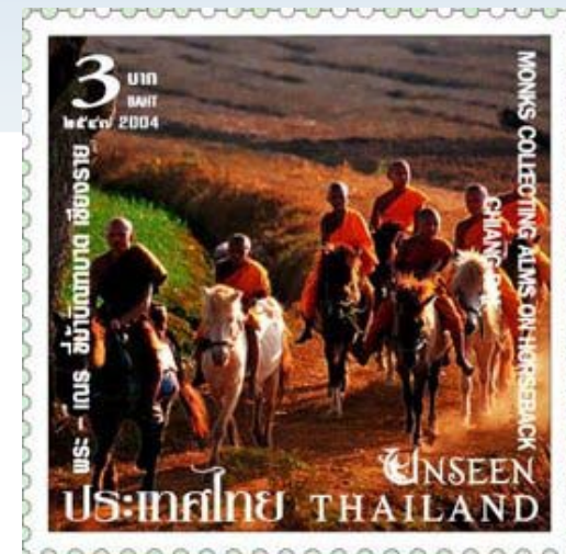
ดวงตราไปรษณียากร “พระ-เณร ชี่ม้าบิณฑบาต เชียงราย”

สำนักปฏิบัติธรรมแห่งนี้ เป็นแห่งแรกๆ ที่ช่วยให้ชาวไทยภูเขาที่อาศัยอยู่บนดอยสูง ได้มีโอกาสศึกษาพระธรรมคำสอนของพระพุทธองค์ โดยที่สำนักปฏิบัติธรรมแห่งนี้ ถือว่าเป็น “อันซีน ไทยแลนด์ (Unseen Thailand)” ของการท่องเที่ยวแห่งประเทศไทย