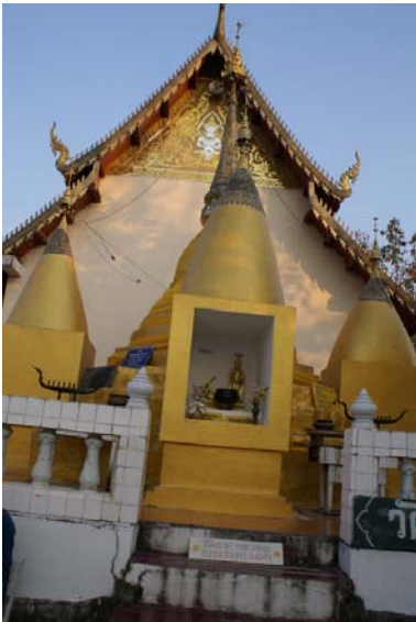
วิหารวัดพระธาตุแม่เย็น

http://i12.photobucket.com/albums/a220/Kesara/wat041/05-.jpg