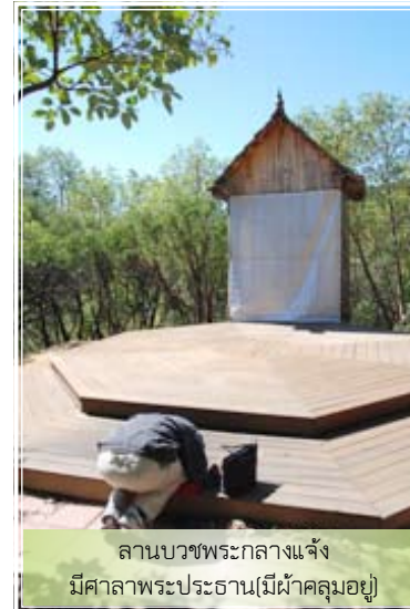
ลานบวชพระกลางแจ้ง มีศาลาพระประธาน(มีผ้าคลุมอยู่)

เวลาเราจะศึกษาอะไรสักอย่างหนึ่ง เราหาตัวอย่าง หา case มาศึกษา เป็นตัวแทนของความรู้ทั้งหมด เรียนศาสนาพุทธก็ศึกษาแบบมีตัวแทนเหมือนกัน