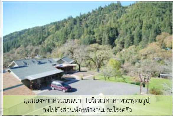
มุมมองจากส่วนบนเขา (บริเวณศาลาพระพุทธรูป) ลงไปยังส่วนห้องทำงานและโรงครัว

เมื่อคนรำลึกกันว่านางเป็นถึงโสดาบัน แต่กลับยื่นอาวุธให้สามีนำไปประกอบอาชีพ ก็ได้รับคำอธิบายว่าที่หยิบยื่นให้ นั้น ไม่ใช่ด้วยเจตนาว่าสามีจงนำธนูนี้ไปล่าสัตว์ สามีจงนำธนูไปล่าสัตว์มาเลี้ยงชีพคนในบ้านได้มากๆ แต่นางทำไปโดยยึดมั่นอยู่บนความคิดที่ว่า ‘เราจะปฏิบัติต่อสามีตามสมควรแก่หน้าที่ของภรรยา’