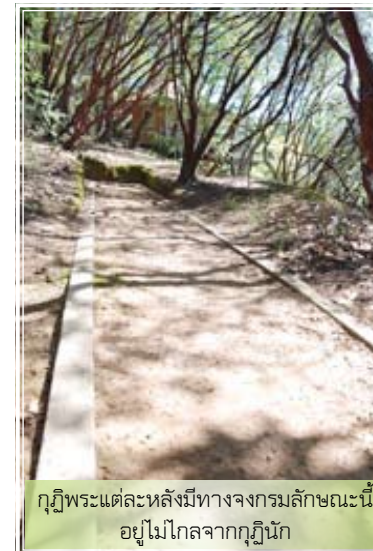
กุฏิพระแต่ละหลังมีทางจงกรมลักษณะนี้ อยู่ไม่ไกลจากกุฏินัก