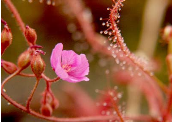
ภาพดอกหยาดน้ำค้าง