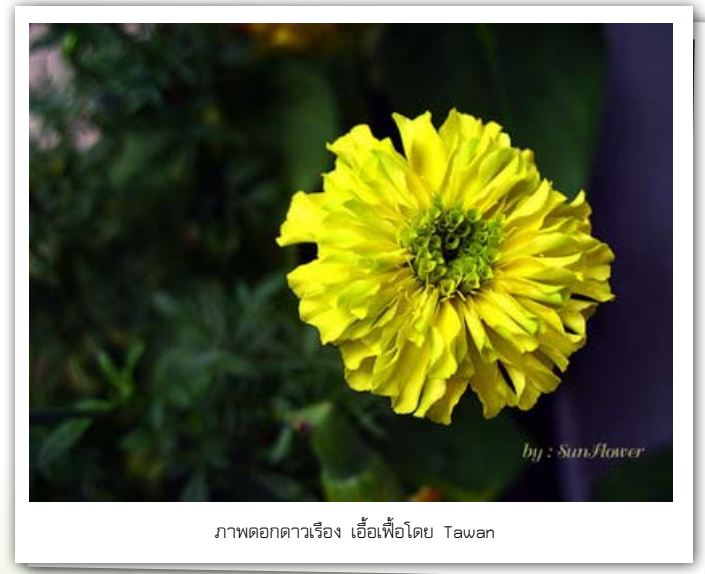
ภาพดอกดาวเรือง

เพราะถูกทำร้ายโดยภรรยาบ่อย ดิกรี massage doctor ของพ่อ