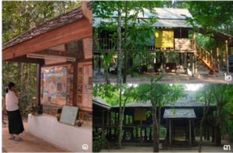
๑. ป้ายแสดงข้อมูลในวัด ๒. ศาลาโรงฉัน ๓. ศาลาโรงธรรม

ใกล้ๆ กับศาลาใหญ่ คือ ศาลาโรงธรรม ซึ่งในอดีตเป็นสถานที่สำหรับทำสังฆกรรมและฟังธรรม และศาลาโรงฉัน ซึ่งในอดีตเป็นที่ฉันภัตตาหาร สิ่งก่อสร้างทั้งสองหลังนี้ก่อสร้างในสมัยหลวงปู่มั่น เป็นโรงไม้ยกพื้นสูงก่อสร้างด้วยฝีมือช่างท้องถิ่นที่มีขนาดใหญ่ด้วยวัสดุต่างๆ ที่บ่งบอกถึงความพอเพียงของคนในยุคนั้น