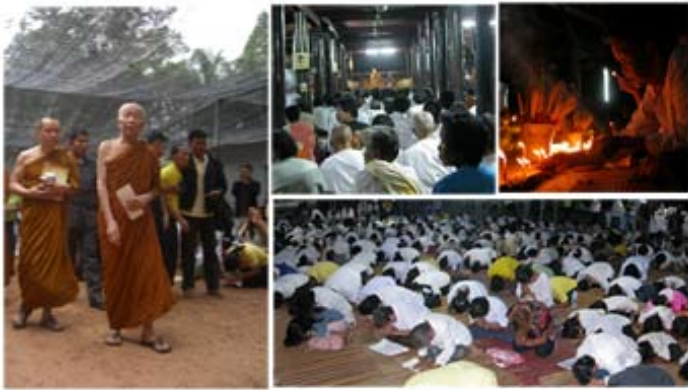
บรรยากาศในวันน้อมรำลึกวันมรณภาพหลวงปู่มั่นในปีที่ผ่านมา

ในช่วงวันที่ ๙-๑๑ พฤศจิกายน ของทุกปีวัดป่าบ้านหนองผือ จะจัดงาน “น้อมรำลึกวันคล้ายวันมรณภาพหลวงปู่มั่น” โดยจะมีการทำบุญฟังเทศน์ฟังธรรม ครุบาอาจารย์พระป่าอีกทั้งประชาชนจากทั่วทุกสารทิศที่ทุกดวงจิตมีความเทอดทูน ในองค์หลวงปู่มั่นมาร่วมงานกัน ด้วยความร่วมมือร่วมใจของชาวบ้านหนองผือที่ ทำให้งานทุกปีดำเนินไปได้อย่างเรียบร้อย ตั้งค่ากล่าวของหลวงตามหาบัวที่ได้ เดินทางมาเป็นประธานในงานว่า “เห็นบุญคุณของชาวบ้านหนองผือเปรียบเสมือน เป็นบ้านพ่อบ้านแม่ ไม่เคยลืม”