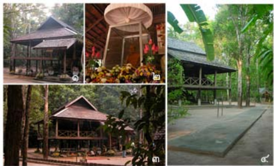
๑.๓. กุฏิที่ตฤฎี ๒. หุ่นขี้ผึ้งหลวงปู่มั่นบนกุฏิ ๔. ทางเดินจงกรมหลวงปู่มั่นที่ข้างกุฏิ

ใกล้ๆ กับศาลาใหญ่ คือ ศาลาโรงธรรม ซึ่งในอดีตเป็นสถานที่สำหรับทำสังฆกรรมและฟังธรรม และศาลาโรงฉัน ซึ่งในอดีตเป็นที่ฉันภัตตาหาร สิ่งก่อสร้างทั้งสองหลังนี้ก่อสร้างในสมัยหลวงปู่มั่น เป็นโรงไม้ยกพื้นสูงก่อสร้างด้วยฝีมือช่างท้องถิ่นที่มีขนาดใหญ่ด้วยวัสดุต่างๆ ที่บ่งบอกถึงความพอเพียงของคนในยุคนั้น