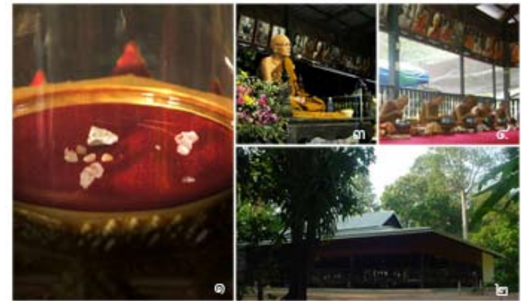
๑. อัฐิธาตุหลวงปู่มั่น ๒. ศาลาใหญ่ ๓. ครูบาอาจารย์แสดงพระธรรมเทศนา ๔. บรรยากาศขณะฉันภัตตาหาร

อันเป็นดั้งเทียนเล่มน้อย ที่ต่อแสงจากเทียนเล่มใหญ่คือ หลวงปู่มั่น ท่านได้ เพาะบ่มทั้ง ปฏิบัติ และ คุณธรรม ซึ่งท่านเหล่านั้นยังสร้างความร่มเย็นขึ้นนำทาง พันทุกชีให้พุทธศาสนิกชนจนถึงปัจจุบัน ที่วัดป่าบ้านหนองผือนี้ก็เป็อีกแห่งหนึ่งที่ เปรียบดั่งมหาวิทยาลัย ที่สมบูรณ์ทั้งทฤษฎีและปฏิบัติ มีประกาศนียบัตร คือ คุณธรรมในความพ้นทุกข์ของแต่ละท่าน ในปัจจุบันสิ่งก่อสร้างในยุคหลวงปู่มั่น ยังได้รับการรักษาไว้ เคียงคู่กับสิ่งก่อสร้างในยุคปัจจุบันที่สร้างขึ้นตามความจำเป็น