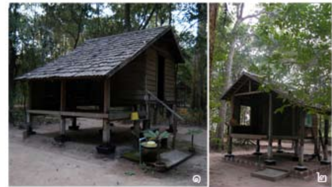
กุฎีในสมัยที่ครูบาอาจารย์ได้มาศึกษาธรรมกับหลวงปู่มั่น ๑. กุฎีหลวงตามหาบัว ๒. กุฎีหลวงปู่วิรังค์

และสิ่งก่อสร้างที่สำคัญที่สุดในวัดก้คือ “ฐิตัตถกุฎี” กุฎีอันเคยเป็นที่พำนัก ของหลวงปู่มั่น เป็นกุฎียกพื้นสูงมีชานอยู่โดยรอบที่ในอดีตที่หลวงปู่มั่นยังมีชีวิตอยู่ จะมีพระเณรขึ้นมาทำข้าววัตรอุปัฏฐาก ในตอนค่ำพระเณรจะมาบริการอบรม แนวทางการปฏิบัติจากหลวงปู่มั่น ซึ่งภาพในคำค้นที่หลวงปู่มั่นอบรมสั่งสอนนี้ ยังตราตรึงอยู่ในความทรงจำของบรรดาลูกศิษย์ที่ปัจจุบันคือครูบาอาจารย์ผู้ใหญ่ที่ ท่านได้บันทึกไว้ในประวัติของท่าน ได้แก่ หลวงตามหาบัว ญาณสมปนฺโน, หลวงปู่ชา สุภทฺโร, หลวงปู่หล้า เขมปตฺโต เป็นต้น เมื่อเราได้ไปอ่านแล้วสามารถจินตนาการ บรรยากาศนั้นขึ้นมาได้ทันที ในบริเวณด้านล่างยังมีทางจงกรมแสดงถึงความเพียร ของหลวงปู่มั่นแม้ในวัยชรา ปัจจุบันในบริเวณกุฎีจะมีผู้แวะเวียนมากราบนมัสการ และนั่งสมาธิภาวนารำลึกถึงพระคุณอันยิ่งใหญ่ของหลวงปู่มั่น และถือว่เป็นสถานที่ ที่ศักดิ์สิทธิ์ควรที่ทุกคนจะทำความไม่ประมาทและศีกคะนอง